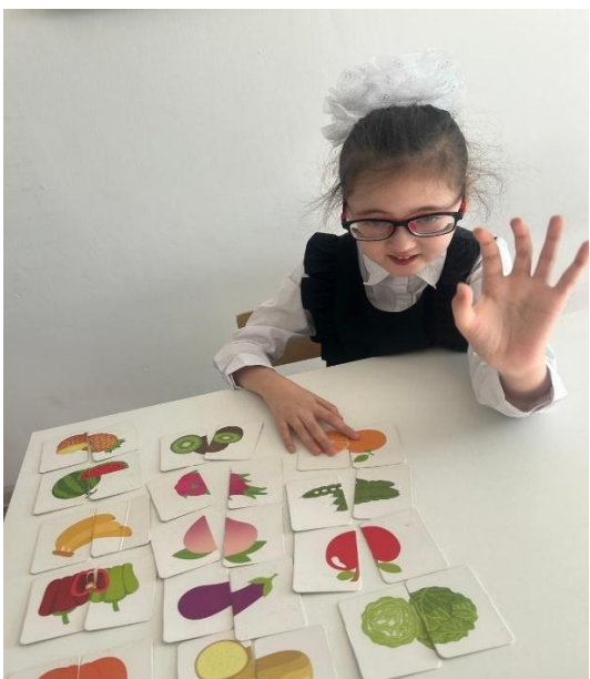
«Жемістер мен көкөністерді тану және айыру» тақырыбы