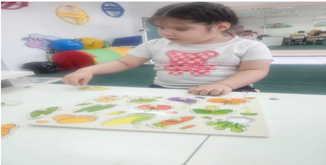
«Көкөністер» тақырыбымен жұмыстары