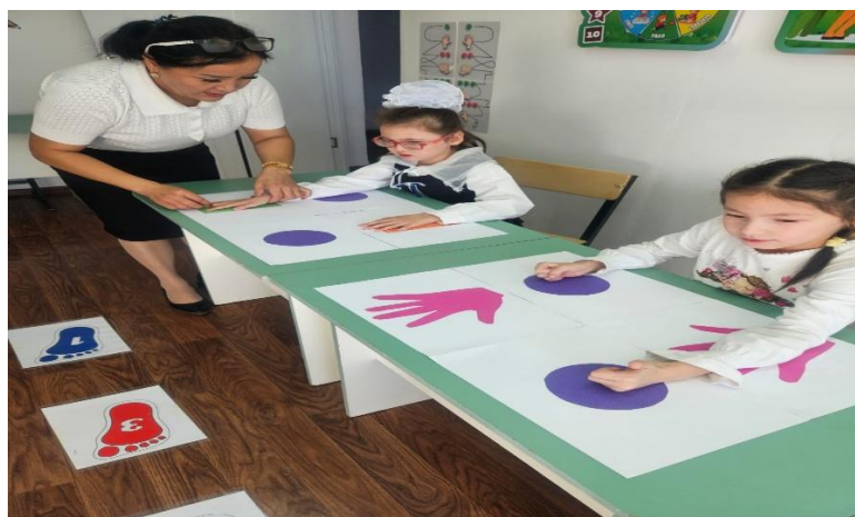
«6 саны» тақырыбы бойынша сабақ