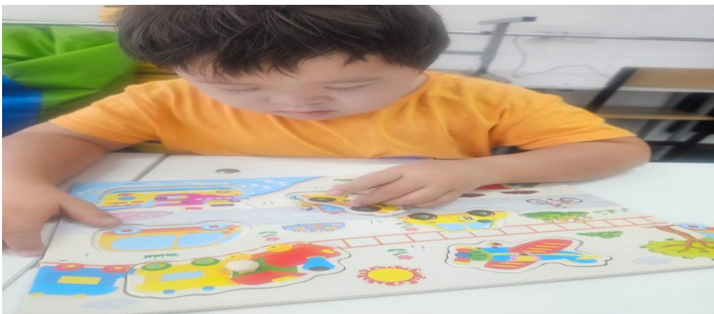
«Көліктер» тақырыбымен жұмыстары