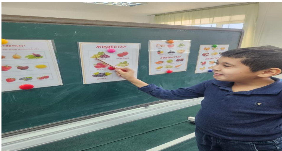
«Көкөністер, жемістер, жидектер» тақырыбы